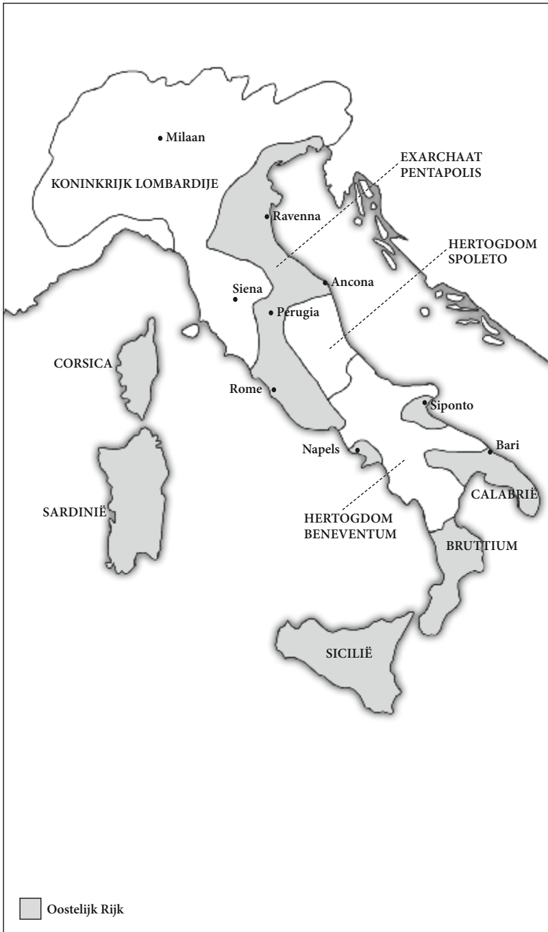
KAART 1 ITALIË OMSTREEKS 600